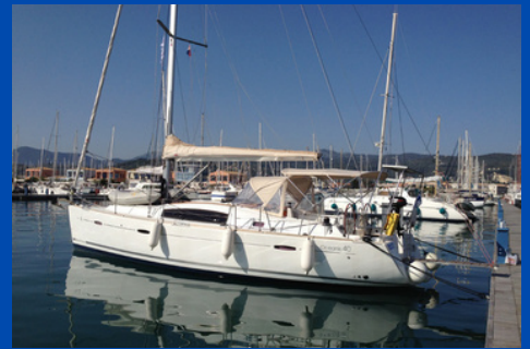
Beneteau Oceanis 40 | SY Galaxy

Bj. 2017, Rollgroß, Rollgenua, Bugstrahlr. 2 WC, Kabinen/Kojen: 2/4 Charterpreis pro Woche 1.790-2.980€