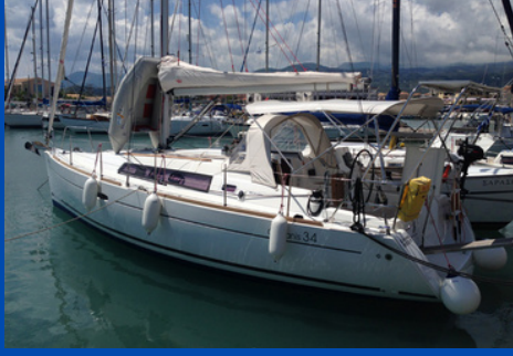
Beneteau Oceanis 34 | SY Calma

Bj. 2015, Rollgroß, Rollgenua 1 WC, Kabinen/Kojen: 2/4 Charterpreis pro Woche 1.470-2.260€