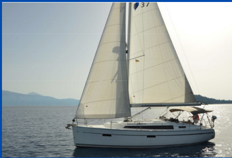
Bavaria 37 Cruiser | SY Helena

Bj. 2016, Rollgroß, Rollgenua 1 WC, Kabinen/Kojen: 3/6 Charterpreis pro Woche 1.338-3.025€