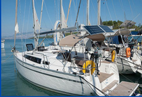
Bavaria 33 Cruiser | SY Dione

Die Base unserer Charterschiffe befindet sich auf der Insel Lefkas. Wir verchartern Samstag bis Samstag. Wir kennen jedes Schiff und garantieren einen tadellosen Zustand der Yachten, insbesondere auch der älteren Schiffe. Ein Segelbefähigungsnachweis ist notwendig. Die Charterpreise variieren saisonal. Die angegebenen Preise sind incl. Steuer, Wäschepaket und auf Wunsch einer Revier- und Törnberatung von Meganisi Sailing Chef Martin Schwark.