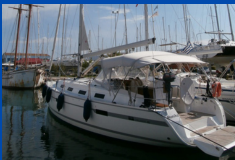
Bavaria 40 Cruiser | SY Monika

Bj. 2010, Lattengroß mit Lj., Rollgenua 2 WC, Kabinen/Kojen: 3/6 Charterpreis pro Woche 1.600-3.150€