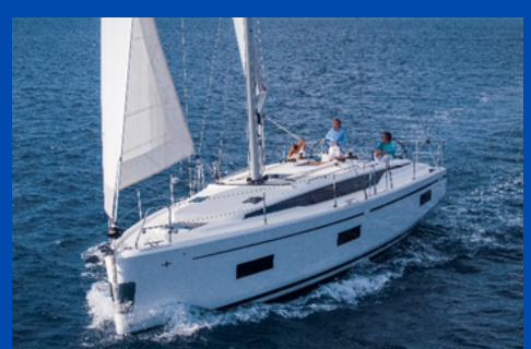
Bavaria C 42 | SY Mila

Bj. 2013, Rollgroß, Rollgenua, Bugstrahlr. 2 WC, Kabinen/Kojen: 3/6 Charterpreis pro Woche 1.970-3.550€