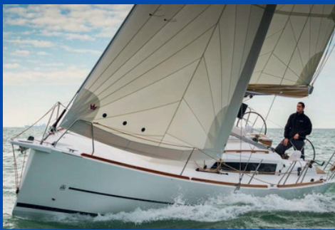
Dufour 350 | SY Erato

Bj. 2017, Rollgroß, Rollgenua 1 WC, Kabinen/Kojen: 3/6 Charterpreis pro Woche 1.640-2.710€