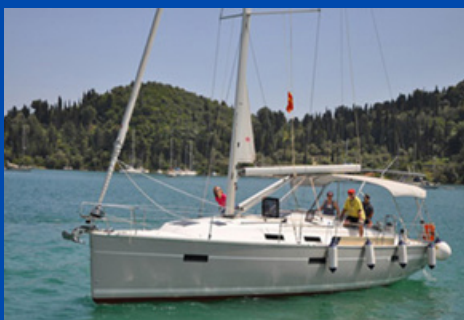
Bavaria 40 Cruiser | SY Erinika

Bj. 2012, Rollgroß, Rollgenua 2 WC, Kabinen/Kojen: 3/6 Charterpreis pro Woche 1.438-3.162€