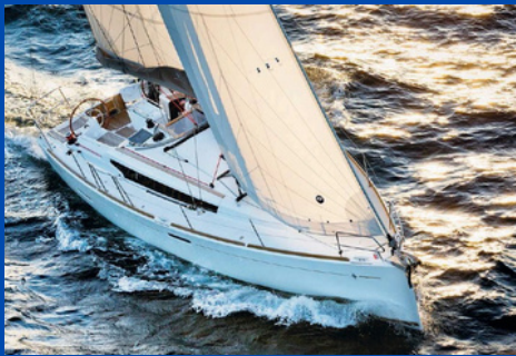
Jeanneau SO 389 | SY Maluna

Bj. 2016, Rollgroß, Rollgenua 1 WC, Kabinen/Kojen: 2/4 Charterpreis pro Woche 1.730-2.840€