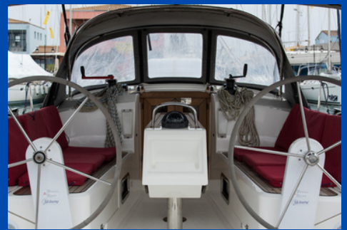
Bavaria 37 Cruiser | SY Mattina

Bj. 2017, Rollgroß, Rollgenua, Bugstrahlr. 1 WC, Kabinen/Kojen: 2/4 Charterpreis pro Woche 1.640-2.710€