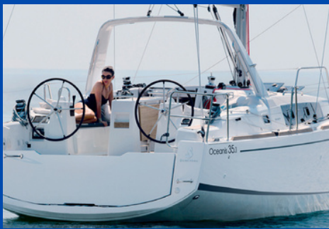
Beneteau Oceanis 35.1 | SY Sirena

Bj. 2017, Rollgroß, Rollgenua 1 WC, Kabinen/Kojen: 3/6 Charterpreis pro Woche 1.640-2.710€